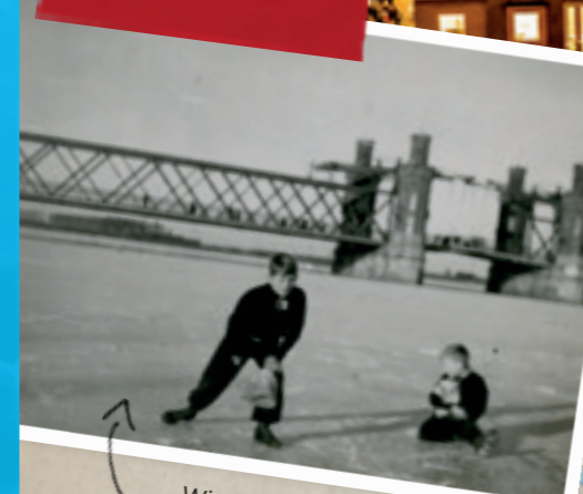
Winter 1933; spelen op de bevroren IJssel!

Ook in de winter is Kampen het bezoeken waard. Dus: plof nog één keer op de bank onder een dekentje om dit magazine te lezen. Laat je inspireren en geniet daarna met volle teugen van de winter in Kampen!